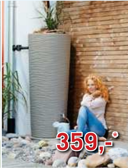
Natura 2in1 Regentank 350 L inkl. Pflanzschale