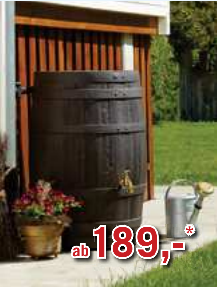
Barrica Regenfass 260-420 L in naturgetreuer Holzfassoptik