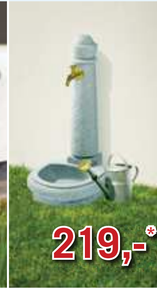
Brunnen Venezia in Steinoptik inkl. Auslaufhahn