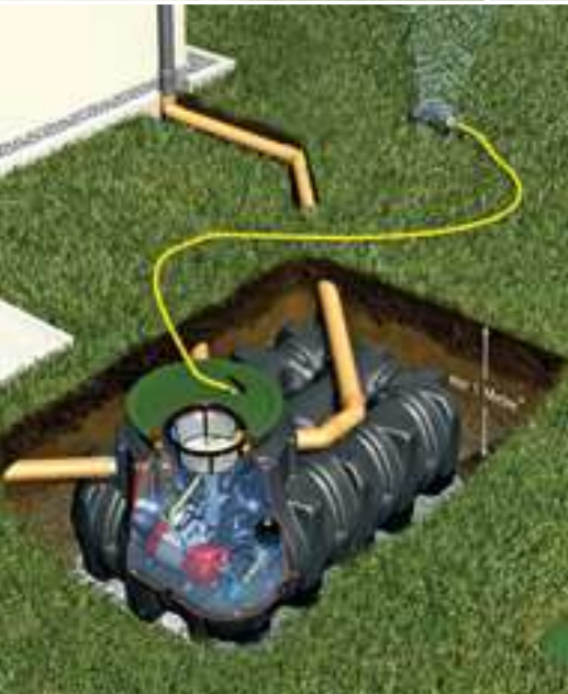
Flachtank Platin 1500 - 7500 L