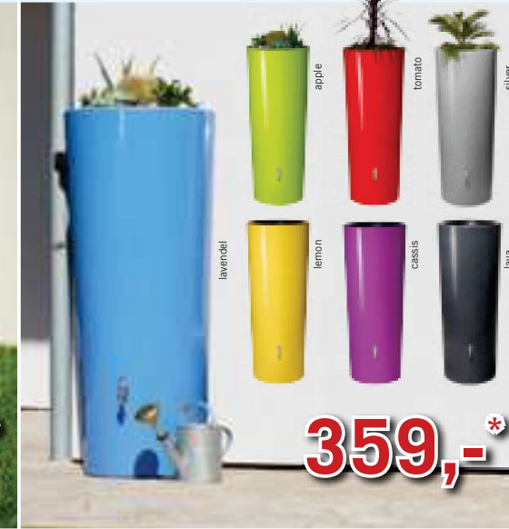
2in1 Color-Regentank 350 L inkl. Pflanzschale