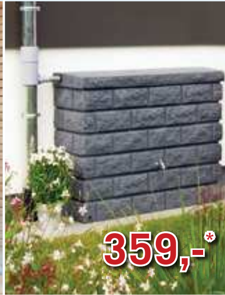
Rocky-Wandtank 400 L in darkgranite, redstone, sandstone